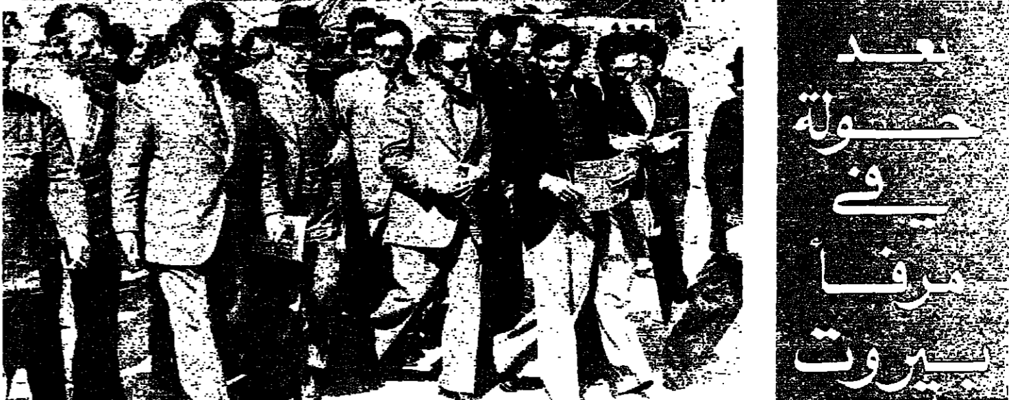
وزير الموارد ومراقبته في المرزا